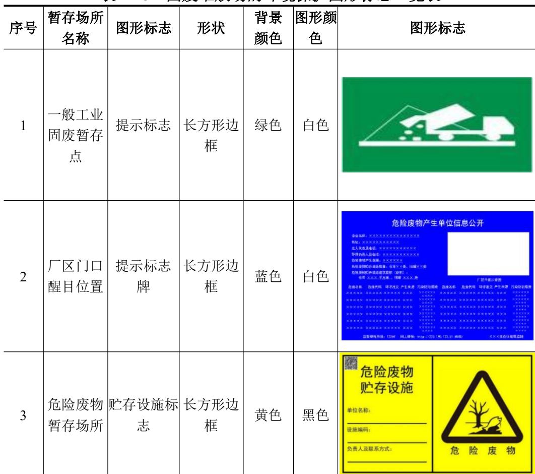
表 4-28 固废堆放场的环境保护图形标志一览表

根据《环境保护图形标志一固体废物贮存(处置)场》(GB15562.2-1995)及修改单、《危险废物识别标志设置技术规范》(HJ1276-2022)要求设置危险废物暂存间的环境保护图形标志,本公司固废堆放场的环境保护图形标志的具体要求见表 4-28。