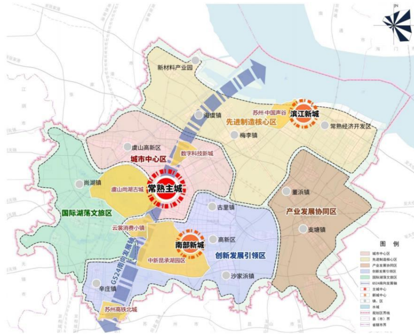
图 1-2 市域国土空间总体格局图

综上所述，本项目符合《常熟高新技术产业开发区发展总体规划（2016~2030）环境影响报告书》评价结论及审查意见和《常熟市国土空间总体规划（2021—2035 年）》中“三区三线”的相关要求。